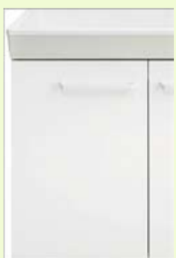
VP1H 扉：VP1(約白) 洗面器：約白