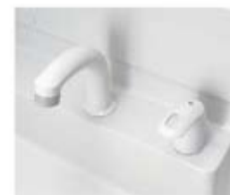
シングルレバー洗髪シャワー水栓 SF-500SN-MB11