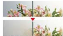
くもり止めコートなし くもり止めコート付

ヒーター式に比べ待ち時間がなく、消し忘れもなし。消費電力ゼロで快適に使用できます。